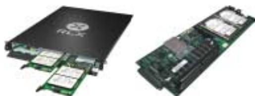
Serveurs ultra-compacts et puissants Jusqu'à 6 serveurs dans un rack 1 U et 24 dans un 3 U

Nous proposons aussi tout type de serveur classique NT ou Linux. Composés selon votre demande, ils sont conçus et testés par notre équipe. C'est la solution la plus évolutive et adaptée à vos besoins.